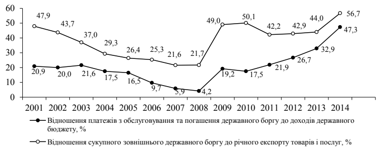
Рис. 2. Динаміка окремих показників боргової безпеки національної економіки