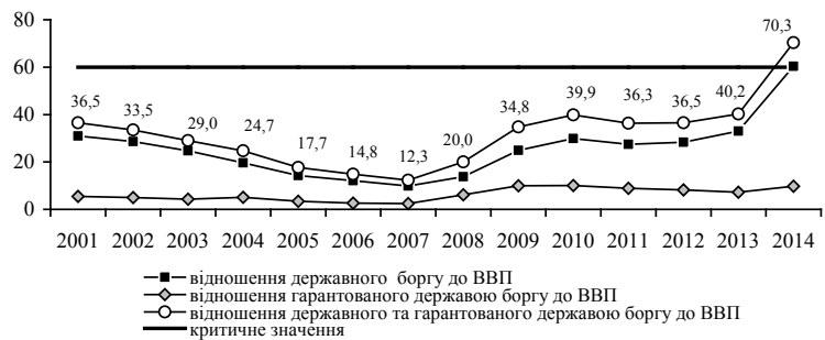
Рис. 1. Співвідношення обсягу державного боргу та ВВП в Україні, %

Обсяг, структура боргу та умови здійснення державних запозичень впливають на макроекономічні параметри розвитку та фінансову стійкість