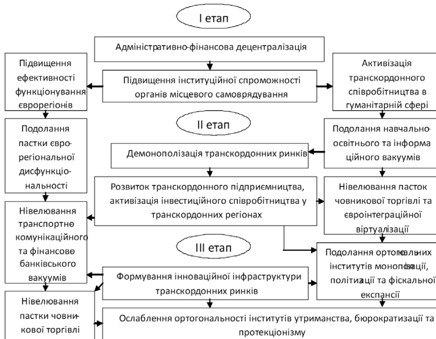
Рис. 2. Алгоритм ліквідації інституційно-правових бар'єрів у транскордонних регіонах між Україною та ЄС

- деградації соціального простору регіону через «розмивання» середовища формування середнього класу, порушення структурних співвідношень між «включенням» і «виключенням» різних груп населення з соціальних та економічних процесів, між ринком та державою, між збагаченням та маргіналізацією (обіднінням) населення, між суспільством і особистістю, між розвитком економіки та станом навколишнього середовища, між збереженням національної само-