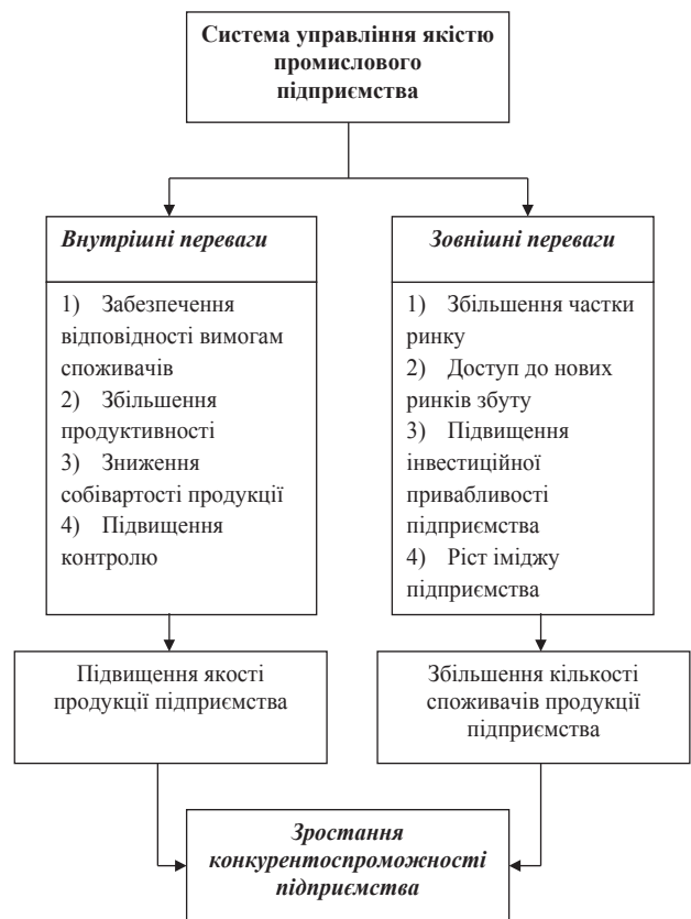
Рис. 2. Забезпечення конкурентоспроможності вітчизняних підприємств за рахунок впровадження системи управління якістю