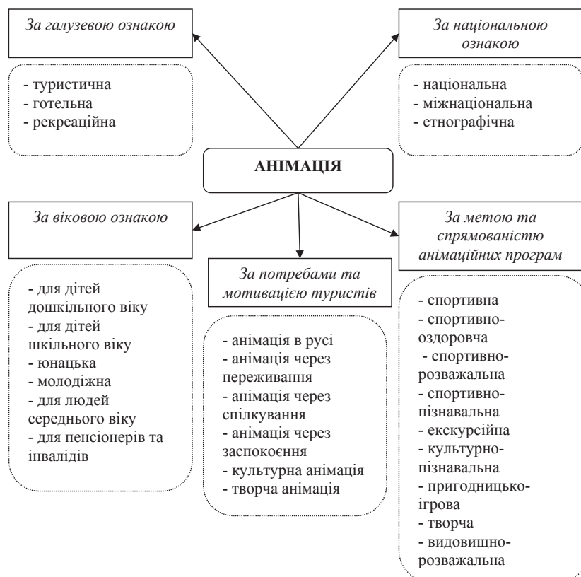
Рис. 2. Класифікація туристичної анімації

В туризмі та індустрії гостинності під анімаційною програмою розуміють план проведення розважальних заходів, який об'єднаний загальним задумом та метою. Анімаційні програми для різного віку та соціального статусу туристів розробляються задля урізноманітнення культурно-дозвілєвих послуг, які надаються додатково підприємствами готельно-ресторанної і туристичної сфери. Анімаційна програма має певну сюжетну лінію, сценарій, головних дійових осіб, представлених аніматорами, музичний супровід. В залежності від мети та спрямованості анімаційних програм анімація буває спортивна, спортивно-оздоровча, спортивно-пізнавальна, культурно-пізнавальна, пригодно-ігрова, творча та видовищно-розважальна.