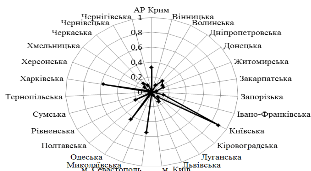
Рис. 3. Значення коефіцієнту залежності індексу росту продуктивності праці та кількості інноваційних підприємств за регіонами України

У контексті даного дослідження важливого значення набуває виявлення залежності між ростом продуктивності праці та кількістю інноваційно-направлених підприємств. Виявлення такої залежності відбувалося аналогічним чином – за допомогою лінійної моделі. Для виявлення коефіцієнта залежності використовувалися результати підрахунку індексу росту продуктивності праці за 2000-2012 рр. та індексу зміни кількості інноваційних підприємств, за аналогічний проміжок часу (за даними Головного управління статистики у відповідній області). Отримані результати зображені на рис. 3.