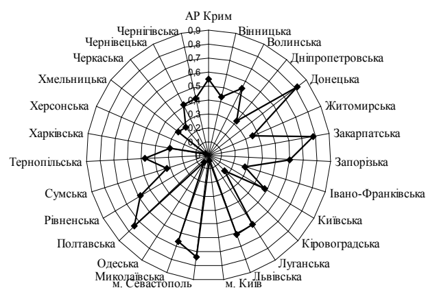
Рис. 2. Коефіцієнт залежності росту продуктивності праці від росту рівня реальної заробітної плати за регіонами України

У контексті нашого дослідження проаналізуємо реальну залежність між рівнем продуктивності праці та заробітною платою у регіонах. Для вирішення поставленої задачі таку залежність було розглянуто за допомогою лінійної моделі. Більш детально коефіцієнт залежності рівня продуктивності праці регіонів від реальної заробітної плати населення зображено на рис. 2.