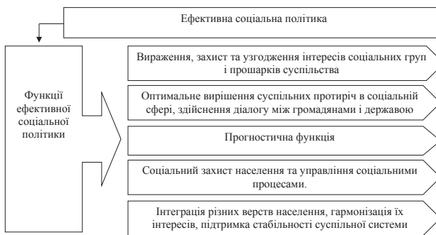
Рис. 3. Основні функції ефективної соціальної політики

Соціальна політика виявляється в управлінні, регулюванні соціальних процесів. Соціальне управління та регулювання є основним механізмом, інструментом реалізації соціальної політики. Зміст соціальної політики, її цілі і завдання розкриваються в системі функцій – відносно самостійних, але тісно пов'язаних видів політичної діяльності (рис. 3).