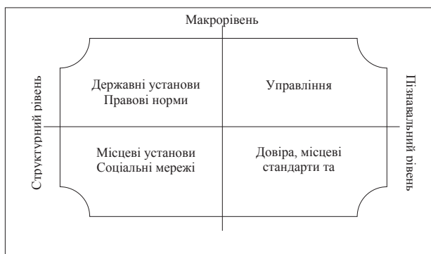
Рис. 2. Виміри соціального капіталу [6]

«Капітальна» складова соціального капіталу виявляється в його здатності знижувати транзакційні витрати, невизначеність та ризик, підвищувати ефективність використання специфічних активів, оскільки соціальний капітал є нематеріальною субстанцією. Соціальний капітал втілений в стосунках, що існують між членами сім'ї, групи, суспільства, нерозривно пов'язаний з ними і тому не може продаватися або передаватися в користування або