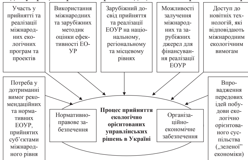
Рис. 1. Вплив факторів міжнародного рівня на процес прийняття екологічно орієнтованих управлінських рішень в Україні

Основні суб'єкти міжнародного рівня та їх взаємодію у процесі прийняття рекомендаційних та нор-