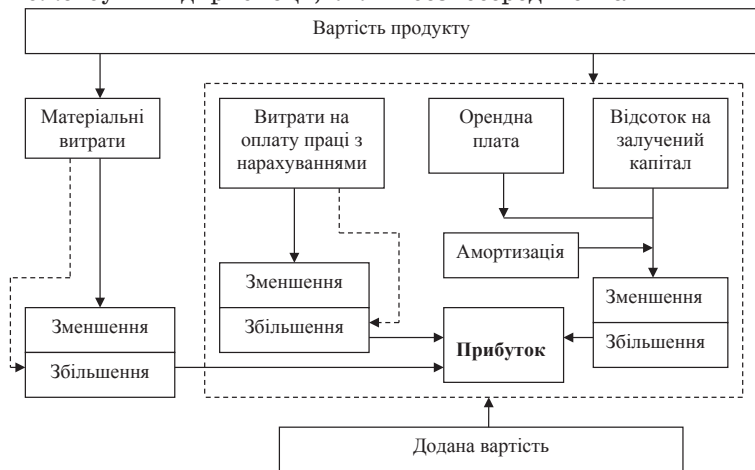
Рис. 2. Схема напрямів збільшення доданої вартості та її результативного елемента – прибутку

Якщо розглядати всю суму вартості продукту, то у даному випадку на збільшення суми прибутку значно впливає і зменшення матеріальних витрат (див. рис. 2). Цьому сприяє застосування ре-