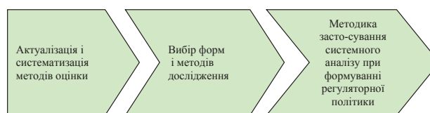
Рис. 1. Методологічна послідовність проведення системного аналізу регуляторної політики держави щодо забезпечення економічної безпеки аграрного сектору

Методологічну спрямованість системного аналізу регуляторної політики держави щодо забезпечення економічної безпеки аграрного сектору у загальному вигляді представимо наступним ланцюгом операцій (рис. 1).