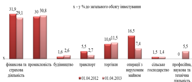
Рис. 2. Розподіл прямих інвестицій за основними видами економічної діяльності за 2012-2013 рр.

Розподіл прямих інвестицій за основними видами економічної діяльності наведено на рис. 2.