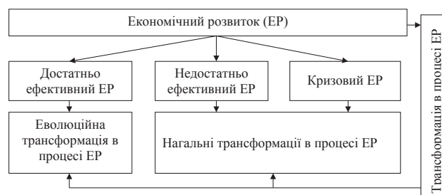
Рис. 3. Характер трансформацій в процесі економічного розвитку

Важливо також виділити види трансформацій в процесі економічного розвитку (рис. 4).