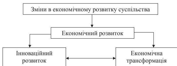
Рис. 2. Взаємозв'язок категорій «економічний розвиток», «інноваційний розвиток» та «економічна трансформація»

З нашого погляду, інноваційний розвиток – це зміни. І трансформація – це зміни. Однак між ними є відмінність (рис. 2).