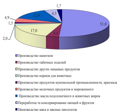
Рис. 2. Структура прямих іноземних інвестицій у виробництво харчових продуктів, напоїв та тютюнових виробів станом на 01.10.2012, % [4]