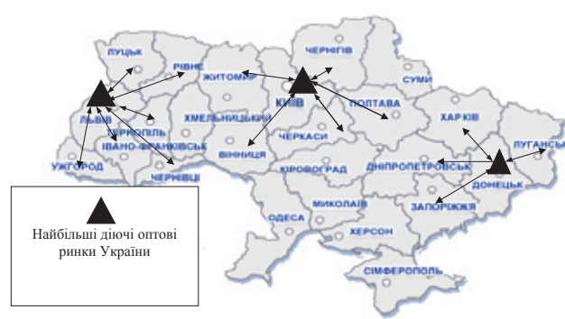
Рис. 2. Оптимальні шляхи надходження продукції на оптові ринки та відповідні напрями її реалізації

За офіційними даними, в областях України вирощується набагато більше овочів і фруктів, ніж споживається. Велику її кількість слід реалізовувати за межами областей (рис. 2).