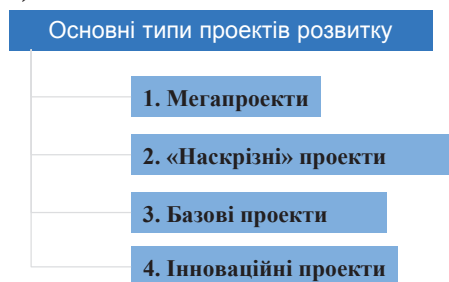
Рис. 2. Типологія проектів

Інвестиційний потенціал регіону складається з галузевого потенціалу, якості ділового середовища та інвестиційного клімату. У свою чергу, галузевий потенціал регіону складається з потенціалу основних, вторинних та підтримуючих галузей. Інвестиційна стратегія повинна включати портфель інвестиційних проектів (типологія проектів – рис. 2).