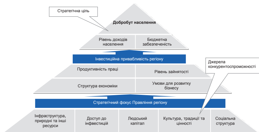
Рис. 1. Піраміда реалізації інвестиційної стратегії із забезпеченням соціально-економічного розвитку

- галузевих стратегіях, що визначають цілі, пріоритети та основні проекти за галуззю;