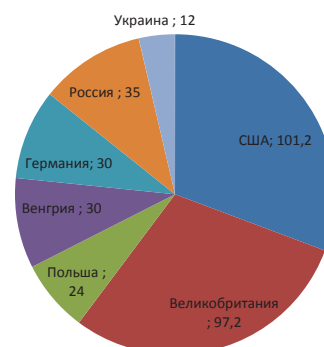
Рис. 1. Структура реальной капитализации фондовых рынков в некоторых странах в 2010-2012 гг, в % [4]

Объем торгов акциями в Украине составляет около 15% общего оборота на организованном рынке ценных бумаг (12 тыс. открытых АО, акции которых могут свободно обращаться на рынке). При этом в 2012 году объем торгов ведущих предприятий своих отраслей равен лишь нескольким десяткам тысяч гривен [4].