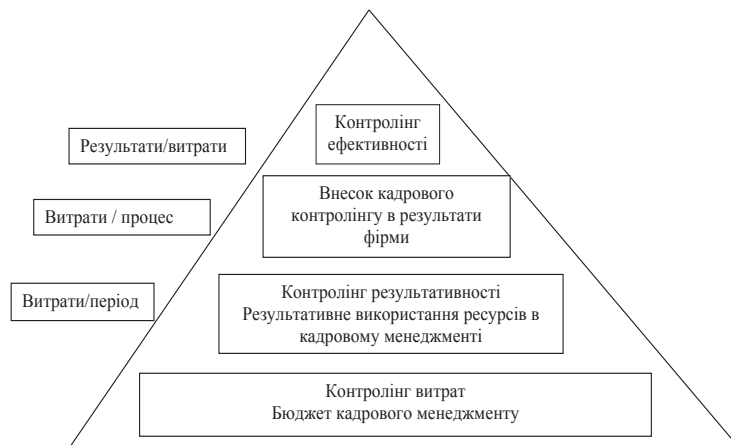
Рис. 1. Рівні контролінгу персоналу

Контролінг персоналу потрібно розглядати як технологію управління, що направлена на розробку рекомендацій та підтримку управлінських рішень у сфері управління персоналом, що допомагає забезпечити досягнення цілей підприємства на основі підвищення гнучкості та адаптивності системи управління персоналом та вдосконалення підходів щодо планування, інформаційно-аналітичного забезпечення та