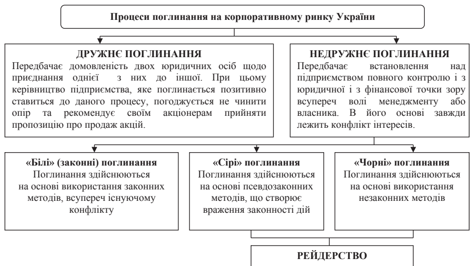
Рис. 2. Види операцій поглинання на корпоративному ринку України