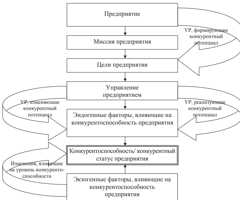
Рис. 2. Структурно-логическая схема проактивного управления устойчивым развитием предприятия на основе повышения уровня его конкурентоспособности

инструментов, формирующую поступательное позитивное (динамичное) развитие предприятия как СЭС, базирующуюся на научно-методическом обеспечении процесса управления его конкурентоспособностью.