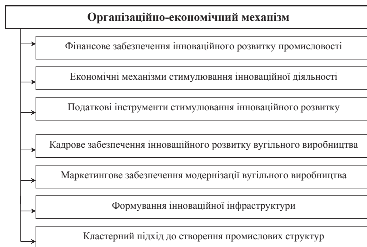
Рис. 1. Напрями вдосконалення організаційно-економічного механізму управління інноваційним розвитком вугільної промисловості

Пропонуються податкові інструменти стимулювання інноваційної діяльності вугільних підприємств (рис. 2).