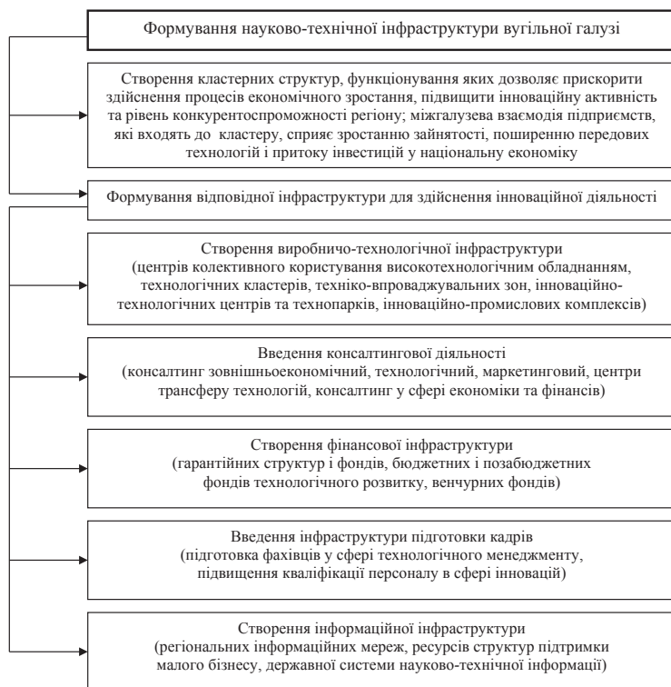
Рис. 3. Напрями формування сучасної науково-технічної інфраструктури вугільної промисловості

узгоджена з ресурсами, технологічними і інституційними обмеженнями, містить вбудовані механізми, які передбачають зміни інститутів і усу-