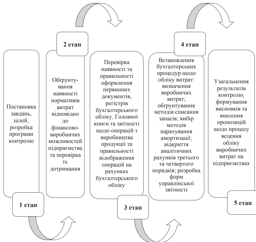
Рис. 2. Етапи проведення внутрішнього контролю виробничих витрат

Отже, найвищою ефективністю контролю за процесами виробництва можна досягти у випадку його органічної єдності з системами обліку та управління. Своєчасно проведений контроль дозволяє виявити основні причини відхилення від нормативних показників, передбачити можли-