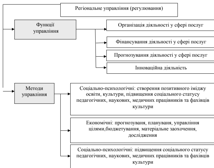
Рис. 3. Функції та методи регіонального управління

Також функції регіонального управління можна поділити на чотири групи (рис. 3). Функції управління здійснюються та реалізуються за допомогою методів управління [4, с. 87].