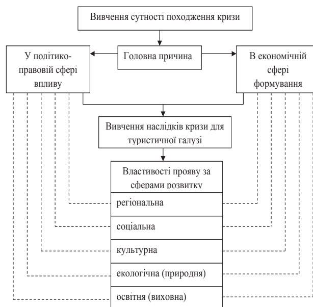
Рис. 1 Структурно-логічна схема вивчення природи кризових явищ у туристичній галузі

Аналіз досліджень і публікацій за визначеною проблемою. Узагальнюючи результати досліджень учених, які вивчають негативні процеси у туристичній галузі та аспекти прояву кризи у ній, можна виділити наступні підходи.