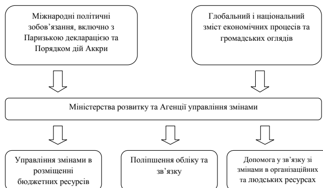
Рис. 2. Зміст управління допомогою розвитку

У вересні 2000 р. на Саміті тисячоліття світові лідери сформулювали вісім цілей, яких світове співтовариство має досягти до 2015 р.: